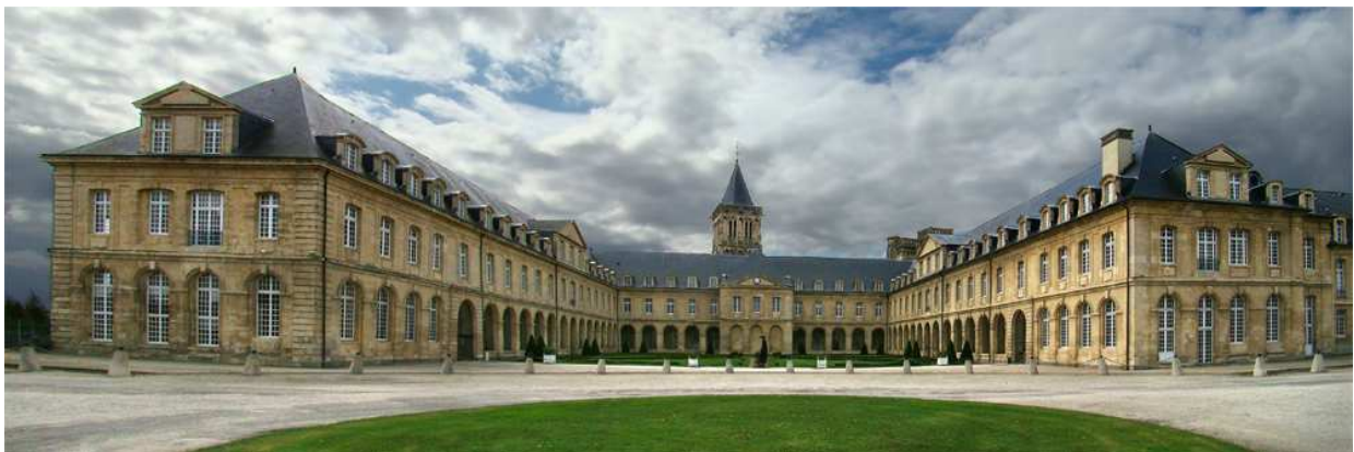
Abbaye Sainte Trinité de Caen

Pour cet effet, jetez souvent les yeux sur Jésus, qui vous est toujours présent, et qui vous pénètre et remplit beaucoup plus que les angoisses et les douleurs, dont vous semblez être toute pleine. Ne voyez rien que Jésus dans vos douleurs et dans vos souffrances; ne voyez que sa bonté et que son amour, qui ordonnent tout ce qui se passe au regard de vous; n'adhérez qu'à lui, ne vous appliquez qu'à lui; n'adhérez point à vos ennuis et à vos déplaisirs; ne les regardez point; ne vous y appliquez point. Détournez doucement et fortement votre esprit toutes les pensées et de tous les objets qui peuvent vous donner inquiétude. Tournez-vous tout entière vers Jésus, qui est tout tourné vers vous, et qui a toujours ses yeux amoureusement fixés sur vous. Tenez-vous bien à lui et à son divin amour, comme à celui qui est votre tout, et hors lequel vous ne voulez plus rien avoir.